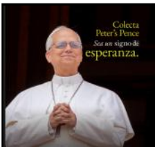
Colecta Peter's Pence Sea un signo de esperanza.

Conviértete en una fuente de esperanza: Edifica a los demás en lugar de concentrarte en sus defectos. Pregúntate con frecuencia: «¿Qué puedo hacer para mejorar esta situación?». La esperanza cristiana no es un optimismo ciego, sino una confianza firme en Cristo, Aquel que es «Fiel y Verdadero» (Apocalipsis 19:11).