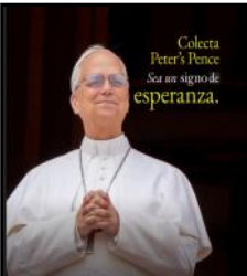
Colecta Peter's Pence Sean un signo de esperanza.

Apoye a quienes han respondido al llamado de Dios. Su donativo ayuda a formar a los futuros sacerdotes y a cuidar de aquellos sacerdotes jubilados que han dedicado su vida al ministerio.